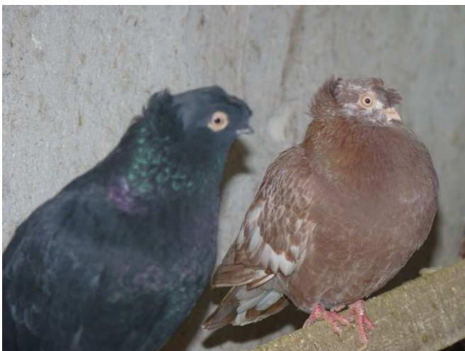
A tarkánál az egyenletes színeloszlás követelmény