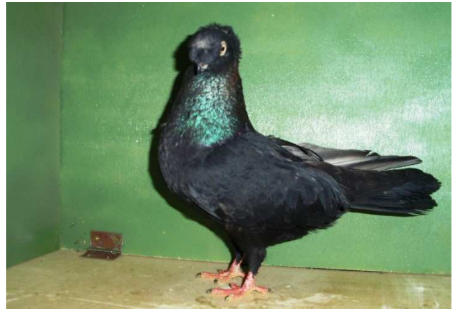
Ideális állás és testtartás.