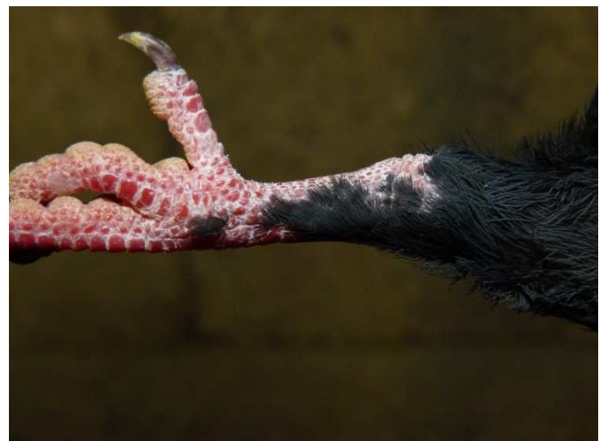
A tollasodó láb hiba