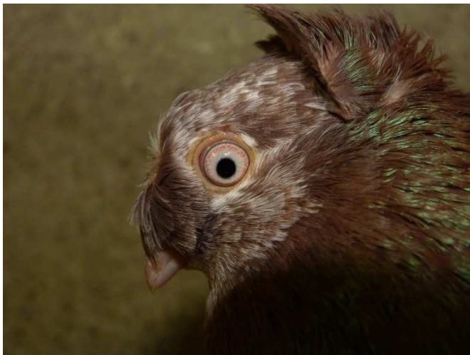
A betűzött fésű ma már kerülendő